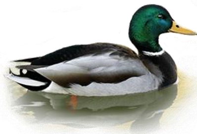
Селезень кряквы (Anas platyrhynchos)

Мы обращаемся к Вам с убедительной просьбой ответить на вопросы, приведенные на обороте этого листа. Ваши ответы помогут оценить объем добычи одного из самых популярных объектов охоты – кряквы. Пожалуйста, укажите точное количество отстрелянных Вами селезней кряквы по итогам весеннего сезона. Важны все результаты, поэтому заполните эту анкету даже в тех случаях, когда Вы получили разрешение на добычу селезней уток, но не охотились, или же Вам не удалось отстрелять ни одного селезня кряквы.